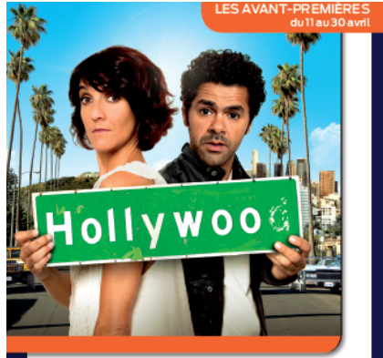
HOLLYWOOD Comédie, le 11 avril en VOD/BLU-RAY/DVD

« D'évidence, ce Potté a vraiment un pedigree de star et il garde plus d'une aventure sous la semelle ». TM6 7 Jours