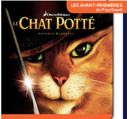
LE CHAT POTTÉ Animation, le 4 avril en DVD

« D'évidence, ce Potté a vraiment un pedigree de star et il garde plus d'une aventure sous la semelle ». TM6 7 Jours